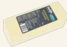
Mozzarella Flavour Block

Medium smältgrad: Perfekt för burgare & toasts