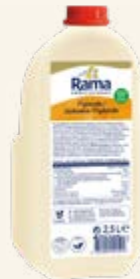
Rama Professional Flytande margarin 78% mjölkfritt