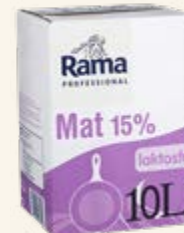
Rama Professional Mat 15% laktosfri