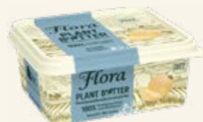
Flora Plant B+tter Havssalt 79%