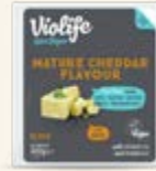
Mature Cheddar Block