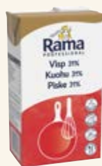
Rama Professional Visp 31%