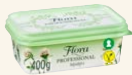
Flora Professional 70%