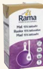
Rama Professional Mat 15% laktosfri