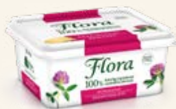
Flora Extrasaltat 59%