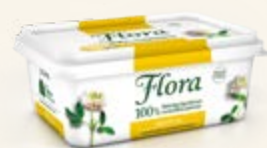
Flora Original Normalsaltat 59%