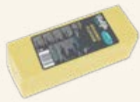
Original Flavour Block for Pizza

Hög smältgrad: Perfekt för pizza, pasta & gratänger