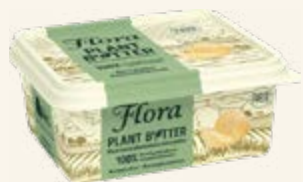
Flora Plant B+tter Normalsaltat 79%