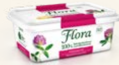
Flora Extrasaltat 59%