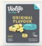
Original Flavour Block

MJÖLK · SOJA · GLUTEN · LAKTOS · NÖTTER KONSERVERINGSMEDEL