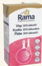
Rama Professional Visp 30% laktosfri