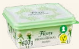
Flora Professional 70%