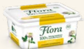
Flora Original Normalsaltat 59%