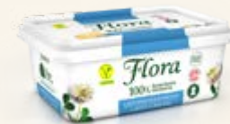
Flora Laktos- & Mjölkfri 59%