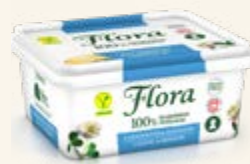
Flora Laktos- & Mjölkfri 59%