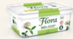
Flora Lätt 38%