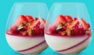
2 VÄXTBASERADE PANNACOTTA