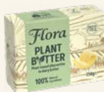
Flora Plant B+tter 79%