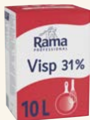
Rama Professional Visp 31%

Krämiga och pålitliga alternativ till mejerigrädde gjorda på vegetabiliska oljor och kärnmjölk