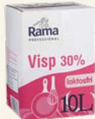
Rama Professional Visp 30% laktosfri