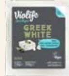
Greek White Block