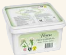
Flora Professional 70%

Njut av den goda smaken av Flora från växtriket!