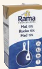
Rama Professional Mat 15%