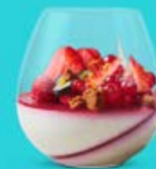
1 MEJERI- PANNACOTTA

Vi förstår att vi är ansvariga för att även våra förpackningar ska vara hållbara och vi vill vara med och leda den utvecklingen. Därför har vi som mål att alla våra nya förpackningar år 2025 ska förutom att vara lätta att återvinna, även vara återanvändbara och certifierat komposterbara.