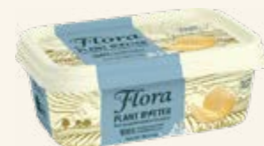
Flora Plant B+tter Havssalt 79%