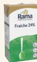
Rama Professional Fraiche 24%