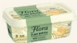
Flora Plant B+tter Normalsaltat 79%